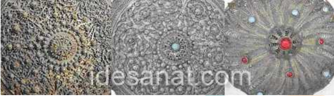
Gümüş Ve Bafon Tepelik Örnekleri Gazipaşa- Merkez B.Deniz, 2008

2.4. Yanak Döven Fesin yanlarında yanaklara sarkıtılarak kullanılan dairesel üçgen ve sembolik şekillerde, zincir, penez ve boncuklarla süslü takılardır. Takıyı takan kişi yürüdükçe takıdaki zincir ve penezlerin hareketinden dolayı "yanak döven" ismi verilir. (25)