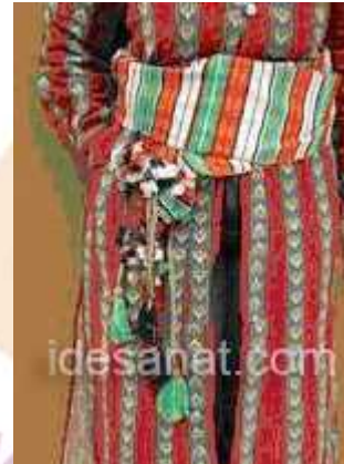
Darabulus Kuşak, Gazipaşa- Merkez, B.Deniz, 2008.