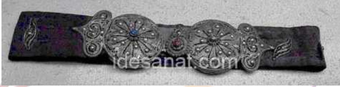
Deri, Gümüş Tokalı Kemer Ö. Aydın,2008.