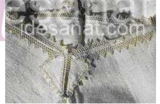
İğne Oyalı Don Paçaları, Serik Karadayı Ö.Aydın 2005