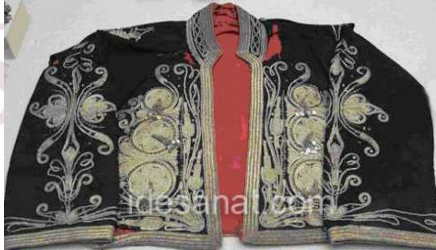
Antalya Arkeoloji ve Etnografya Müzesi Ö.Aydın, 2008

Anadolu'nun birçok yöresinde kadın ve kızlar kollu ve kolsuz cepken giymektedirler. Genellikle çuha ve kadifeden yapılanlar altın ve gümüş tellerle işlenmiştir. İlikli ve iliksiz örneklerine rastlanılmaktadır. Bitkisel ve hayvansal motiflerin yanı sıra mimari özellikte olanları da vardır. Cepkenlerin kısa oluşları kalın kuşak bağlama geleneğinden ve bele takılan maden, kumaş ve boncuk kemerlerin, üzerini örtme endişesinden olabilir. Uzunlarına salta ya da sarka denilmektedir. Libade ise hırka ve kolsuz yeleklerdir. (11)