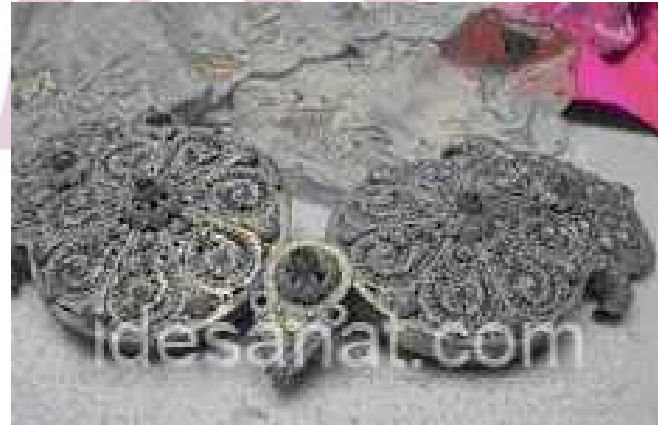
Kemer Tokası, Antalya Arkeoloji ve Etnografya Müzesi Ö.Aydın,2008