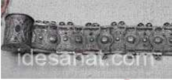
Gümüş Kemer, Antalya Arkeoloji ve Etnografya Müzesi