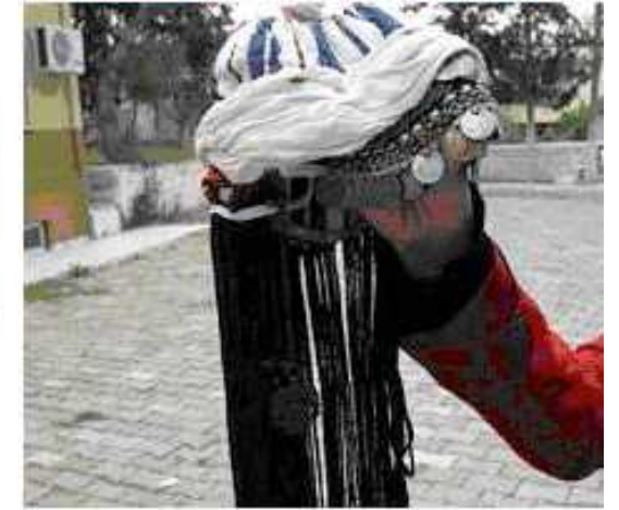
Saç Kuru Gazipaşa Merkez, B.Deniz,2008