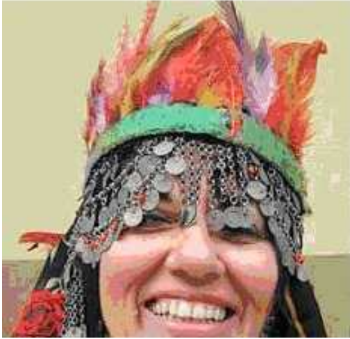
Tozuk, Gazipaşa-Merkez B.Deniz,2008.