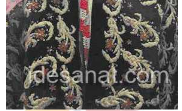
Göynek Yakası , Antalya Arkeoloji ve Etnoğrafya Müzesi, Ö.Aydın,2008.

Gömlük bezler ya düz beyaz veya beyaz üzerine kırmızı, sarı, mavi renklerin uçuk tonları ile ince çubuklu (çizgili) olarak dokunurdu. Bürümcükten dokunanlara "helali, helali gömlek" denilmektedir. (8) Ketenden, ipekten, ham ipekten, bürümcükten yapılan gömleklerin ucu şalvarın içine çekilir, yakasına, kol ağızlarına iğne oyası geçirilirdi. Halk şairlerimizin, özellikle düğmeleri üzerinde durdukları bu gömlekleri, kızlar kendi tezgahlarında genç kızlık süresince kendi elleriyle dokurlardı. (9)