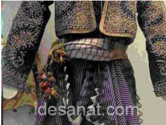
Alanya kuşağı, Ö.Aydın, 2008

Anadolu erkeği ile kadınının kuşak bağlama geleneğinde belirgin bir fark göze çarpar. Erkekler bölgelere göre değişen fakat genellikle bel ve karın kısmını saran yer yer kasıklardan göğüs altına kadar genişliğe erişen kuşaklar takarlar. Bu tür kuşaklar kadınlarımız tarafından kullanılmaz. Arkalık ve önlük takarlar. Üçgen katlananları vardır. Anadolu'da bunun üzerine püskül eklenmiştir.